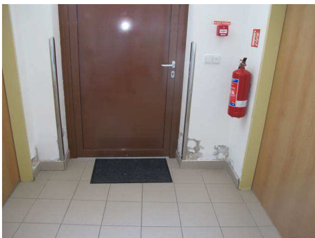
Foto č.7 – vlhkostní projevy na obvodové dvorní stěně u bočního vstupu v m.č. 0.07