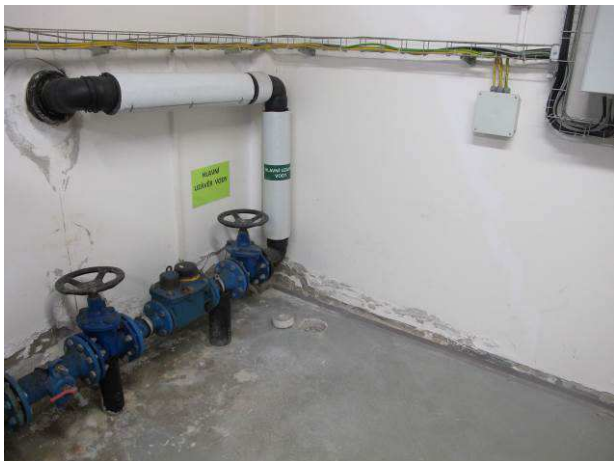
Foto č.13 – vlhkostní projevy ve spodní úrovni a kolem prostupu přes obvodovou zeď v prostoru kotelný (m.č. 0.49), místo vrtané sondy VS1