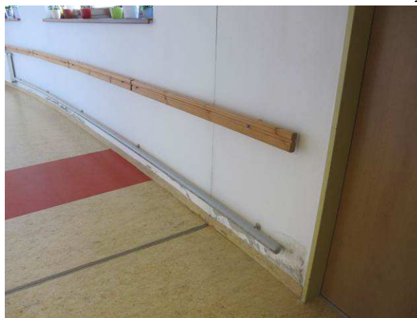
Foto č.8 – vlhkostní projevy na dvorní obvodové stěně ve spodní úrovni na chodbě m.č. 0.104 (budova A) a chodbě m.č. 0.63 (budova B) s viditelnou dilatací mezi oběma budovami