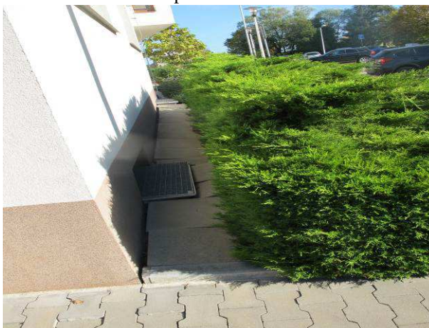
Foto č.6 – posedaný stávající okapový chodník na východní straně objektu vlevo od hlavního vchodu v místě stávající kotelny