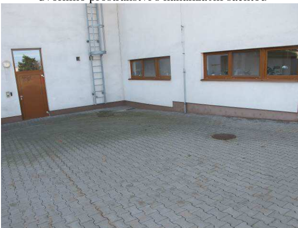
Foto č.4 – směr spádování zpevněné plochy ve dvorním prostoru směrem k objektu do odtokového žlabu ve spodní úrovni