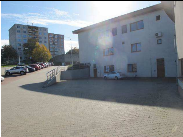
Foto č.1 – dvorní pohled na posuzovaný objekt s charakterem přilehlých zpevněných ploch

HOSPIC FRÝDEK-MÍSTEK, p.o., I. J. PEŠINY 3640, FRÝDEK-MÍSTEK