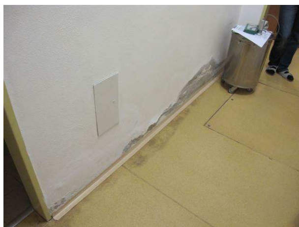
Foto č.12 – vlhkostní mapa se solnými výkvěty na vnitřní stěně v m.č. 0.32, v podlaze je umístěna revizní šachta kanalizace RŠ2