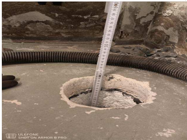
Foto č.14 – hloubka (0,4 m) provedené vrtané sondy VS1 do podlahy v prostoru kotelný