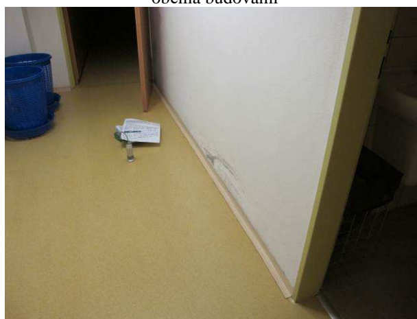
Foto č.10 – vlhkostní mapa se solnými výkvěty na vnitřní stěně v m.č. 0.38