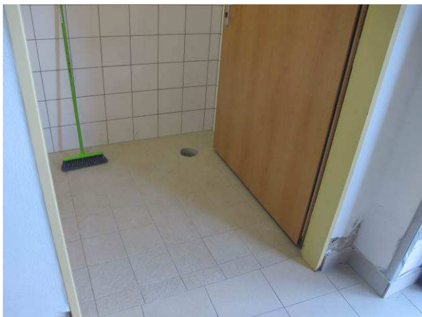
Foto č.17 – pohled na místo vrtané sondy VS2 v m.č. 0.06 (shoz prádla)