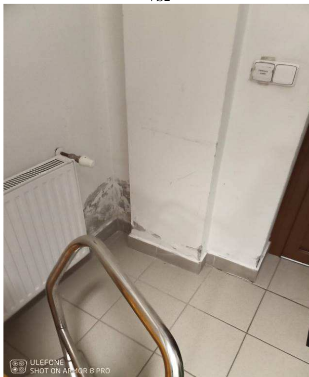
Foto č.22 – vlhkostní projevy na obvodové a navazující vnitřní stěně v m.č. 0.23a u bočního vstupu