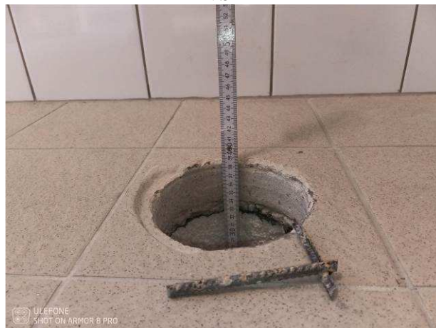
Foto č.18 – hloubka (0,4 m) provedené vrtané sondy VS2 do podlahy v prostoru shozu prádla