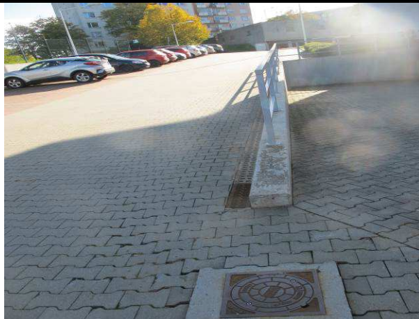
Foto č.2 – zachytný odtokový žlab u opěrné zídky u dvorního prostoru s kanalizační šachtou