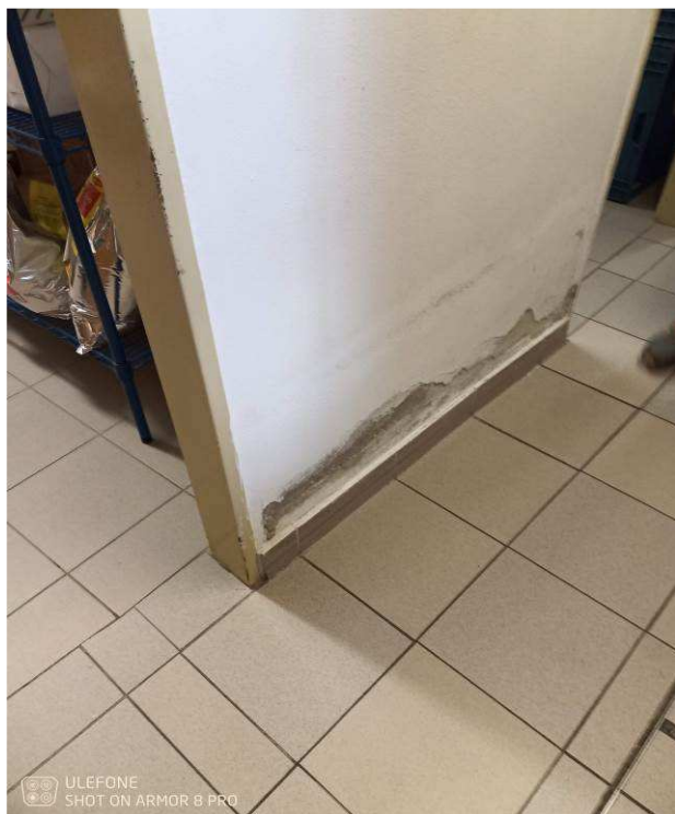
Foto č.21 – vlhkostní projevy na vnitřní stěna na chodbě (m.č. 0.43) u kuchyně