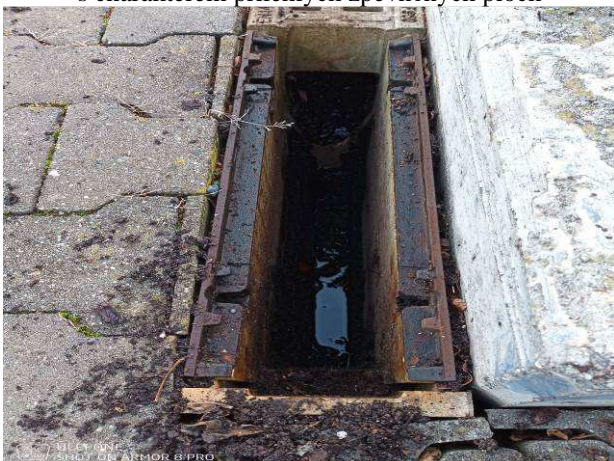
Foto č.3 – pohled na kontrolní kus odtokového žlabu u opěrné zídky, který je zanesený, a tudíž má omezenou funkčnost odtoku srážkových vod