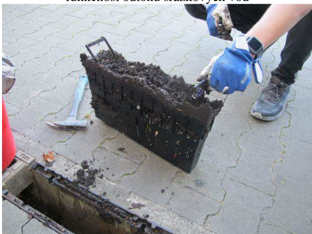
Foto č.5 – zcela zanesený a nefunkční odtokový kontrolní kus na odtokovém žlabu ve spodní úrovni na severní straně podél budovy B