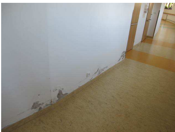
Foto č.9 – viditelné projevy vlhkosti na vnitřní stěně na chodbě m.č. 0.104, za kterou se nachází soc. zázemí pokojů